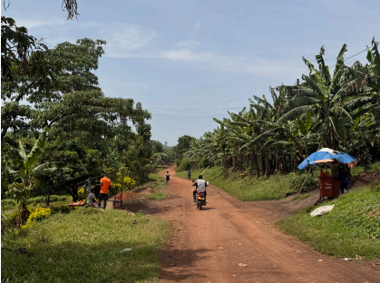
Safari Queen Elizabeth: Parque ornico de Uganda, donde pasaremos dos días para realizar varias actividades. Un safari en coche, y veremos elefantes, jirafas, ántilas y con suerte alguno de los chimpancés que viven en el parque. Aquí también visitamos los chimpancés que viven en la Carpentería de Kyambura . También haremos una salida con una embarcación para hacer una de las experiencias más bonitas del país. Cruzar el canal Kasuga y ver de cerca, aves, cocodrilos, hipopótamos, elefantes... Actividad super recomendable.

Ver los gorilas en libertad en el Bosque Imponentable de Bwindi: sin palmeras