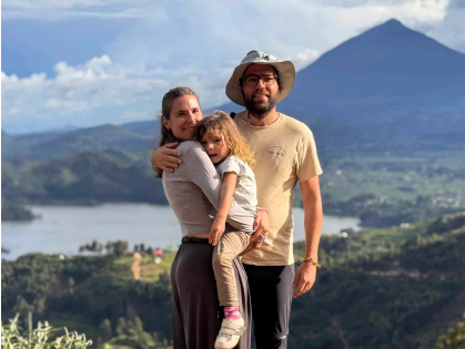
Lago Bangwe: Será nuestra última parada en la Perla de África. El Lago Bangwe, es uno de los lagos más bonitos del Mundo. Pasaremos dos noches en el Lago, disfrutando de su belleza, haciendo turismo por la zona y viendo el impacto de nuestro viaje en una escuela.