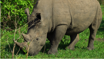
Murchisona Falls: No solo son unas impresionantes cascadas, sino un parque nacional donde haremos nuestro segundo safari en coche y por el río Nilo.

Santuario de Inoceronte Zawi El primero parque donde cuida y protege al Inoceronte y donde podremos hacer un safari a caballo, verlos de cerca e incluso verlos desde nuestra propia habitación (Eso sí, con un poco de suerte).