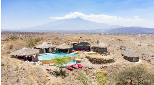
Vistas de las cabinas construidas por masáis y propiedad de la ONG.