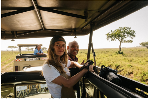
Un safari por Tanzania con un guía masái. Foto Trip to Help.

Una vez terminado el safari de 5 días, pasaremos unos días con la comunidad masái . Serán unos días de turismo vivencial e inmersivo en estado puro que quedarán por siempre en nuestra memoria. Viviremos con y como ellos y conoceremos más de cerca su cultura, tradiciones y creencias.