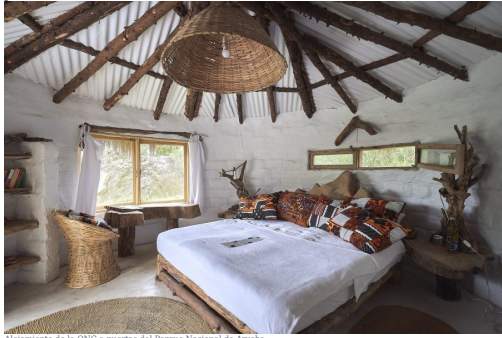
Alojamiento de la ONG a puertas del Parque Nacional de Arusha.

Durante el viaje nos alojaremos en pequeños hoteles sostenibles que tiene la ONG y que gracias a ello financia la educación de miles de niñas y niños. Durante el safari, dormiremos con tendas de campaña bien preparadas por nuestros guías trabajadores de la ONG. Tendremos colchón y almohada y acamparemos en las zonas habilitadas para hacerlo. Hay posibilidad de dormir en hoteles durante el safari .