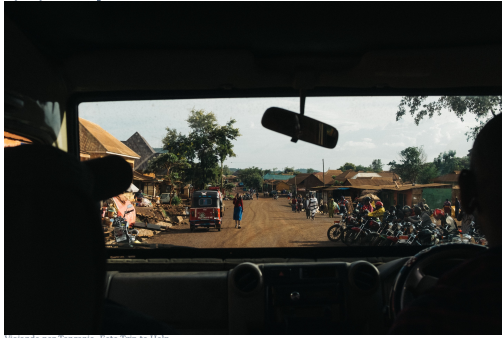
Vista por Tanzania.

10 días de ensaño para disfrutar del turismo inmersivo y regenerativo con la comunidad masái tanzana, de hacer un safari de 5 días lleno de aventura, aprendizajes y las más increíbles escenas, y además, saliendo que nuestro viaje tiene de un impacto positivo. El viaje solidario e inmersivo en Tanzania de 10 días será inolvidable.